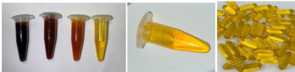
1. att. Iegūtais mikroaļģu Nannochloropsis sp. EPA uztura bagātinātāja prototips

Jēlekstrakta filtrēšanas procesa rezultātā tika iegūts 20% ekstrakta no sākotnējā apjoma, filtrpapīros aizturot apmēram 5 kg vasku, piesātināto taukskābju un citopotenciāli izmantojamo komponentu. Tālāk tika veikta ekstrakta ķīmiskā sastāva analīze un balināšana. Attīrītais ekstrakts saturēja eikozapentaēnskābi (EPA) koncentrācijā līdz 600 mg/g, kas atbilst augstas koncentrācijas izejvielai uztura bagātinātāju izstrādē. Izveidots m mīksto kapsulu produkts, kapsulu apvalks tika izgatavots no augu izcelsmes materiāla, padarot to piemērotu arī vegāniem.