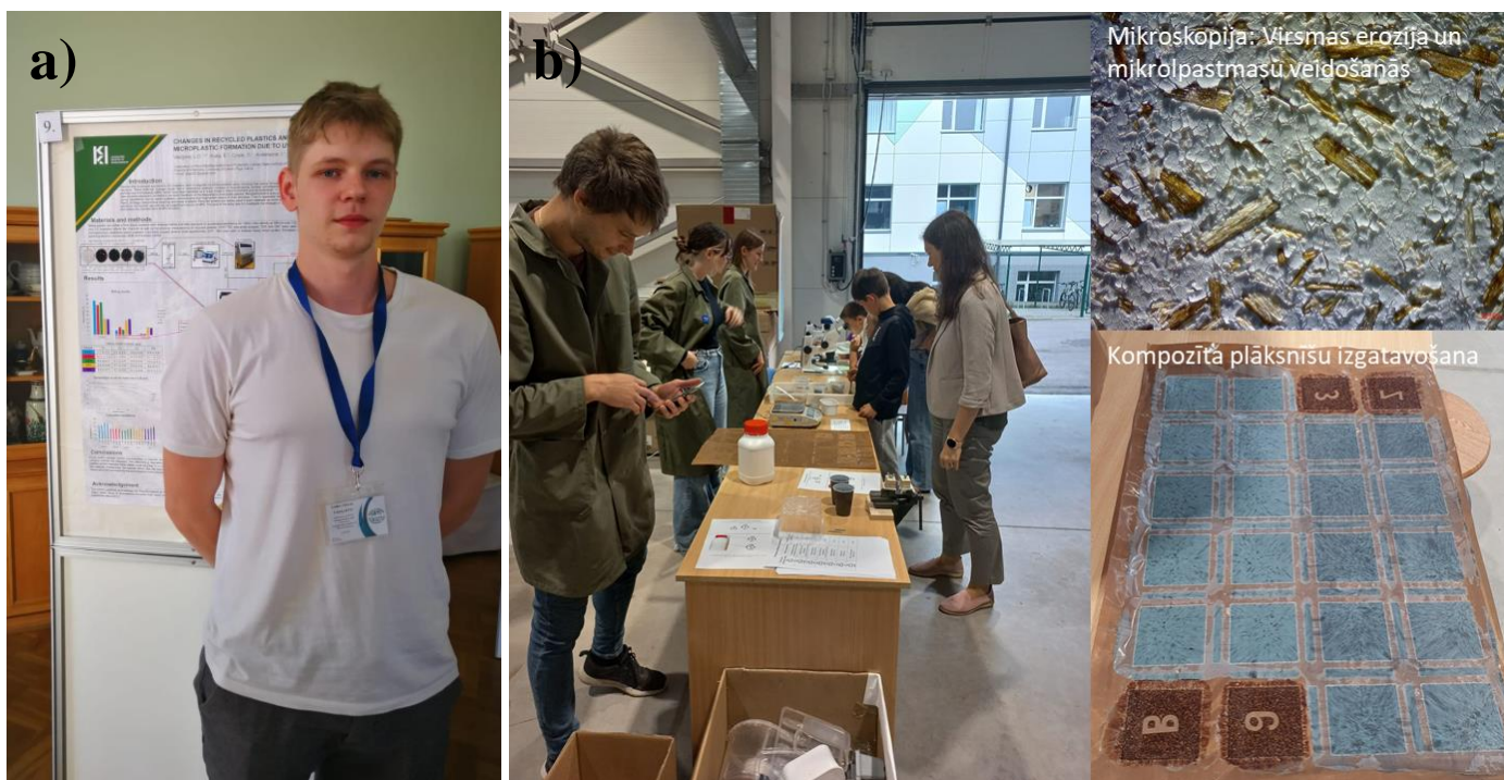
1. attēls. Projektā iegūto rezultātu publicitāte a) uzstājoties ar stenda referātu starptautiskā konferencē Baltic Polymer Symposium 2023 un b) pasākuma “Zinātnieku nakts 2023” ietvaros